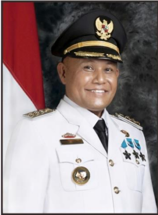
H. NANANG ERMANTO BUPATI LAMPUNG SELATAN

Buku Data dan Fakta merupakan gambaran representatif mengenai kemajuan Pembangunan dan Perkembangan lain dan bisa memberikan gambaran umum mengenai Kondisi dan Potensi yang ada di Kabupaten Lampung Selatan pada tahun 2022